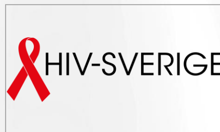
Rättighets- och påverkans- organisation för personer som lever med och berörs av hiv